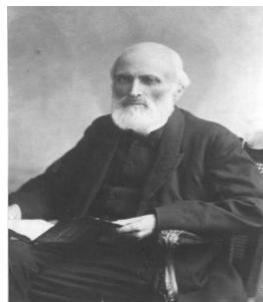
Professor Fenton John Westcott Anthony Hort 1828 - 1892

Hebben we pas na 1880 het 'ware' Nieuwe Testament ontvangen? Zou God Zijn Woord dan tot 1880 verborgen hebben? Zouden alle gelovigen tot 1880 hun geloof dus hebben gebaseerd op een valse Bijbel?