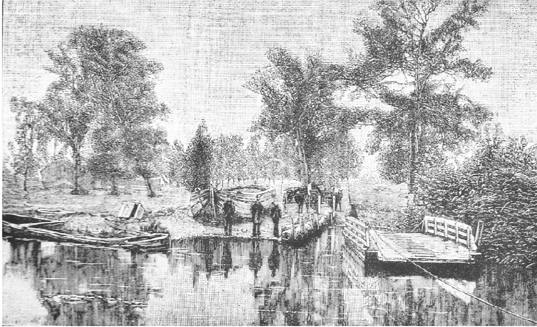
Het veer te Isleham, de plaats waar Spurgeon gedoopt werd.